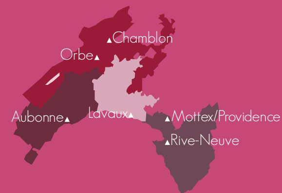
▲ Lits de soins palliatifs

Si la situation du patient hospitalisé dans une telle unité se stabilise, un retour à domicile ou un hébergement en EMS (maison de retraite) peut être envisagé.