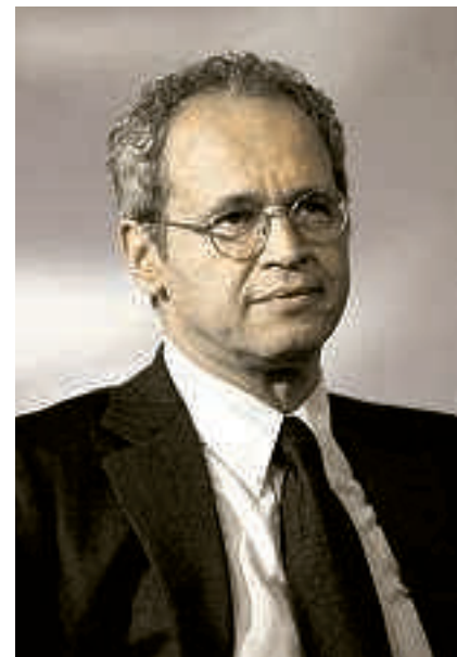
Il noto conduttore televisivo Enrico Mentana.

TOUCH, le monde au bout des doigts Losanna, Musée de la main e Mudac. Fino a gennaio 2013. www.verdan.ch