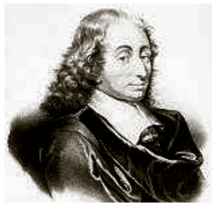
Un ritratto di Blaise Pascal.

Ha scelto parole forti François-René de Chateaubriand per sintetizzare la vicenda umana dell'autore delle Pensées , che proprio trecentocinquanta anni fa s'interrompeva assai precocemente. Molti altri, del resto, hanno associato questa parola, «il genio», «le génie de France» alla figura di Pascal, per descriverne in particolare la precocità dell'intelligenza: a sedici anni, caso più unico che raro, egli già sedeva nella celebre «académie parisiensis», forse il più celebre circolo di scienziati dell'epoca, presieduto dal grande Marin Mersenne, e lì presentò la sua prima opera di geometria, ricordata ancora oggi per il cosiddetto